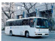
ホテルマイステイズプレミア大森行き to HOTEL MYSTAYS PREMIER Omori