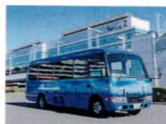
ホテルマイステイズ羽田行き to HOTEL MYSTAYS Haneda

Exit the arrival lobby and go straight until you pass the ticket gate of the train. Go down to the ground floor to the Group Bus stop.